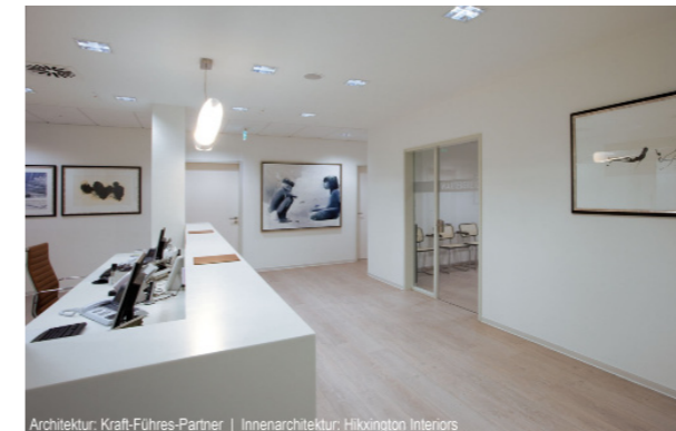
Architektur: Kraft-Führes-Partner | Innenarchitektur: Hixington Interiors