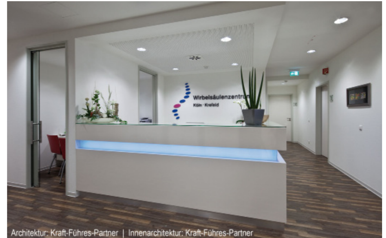
Architektur: Kraft-Führes-Partner | Innenarchitektur: Kraft-Führes-Partner